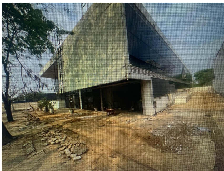
Serviço de SPDA (34,15% do serviço realizado)