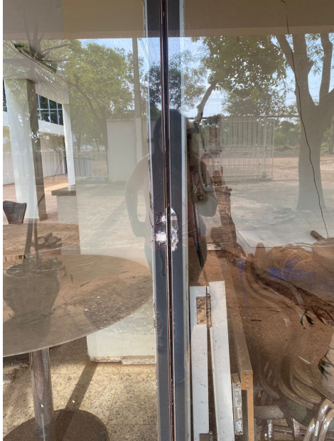
Vidro da Fachada (estacionamento) danificado devido ao furto do dia 09/10/2022