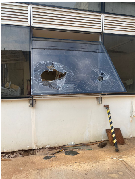
Vidro da janela da Garagem danificado devido ao furto do dia 09/10/2022