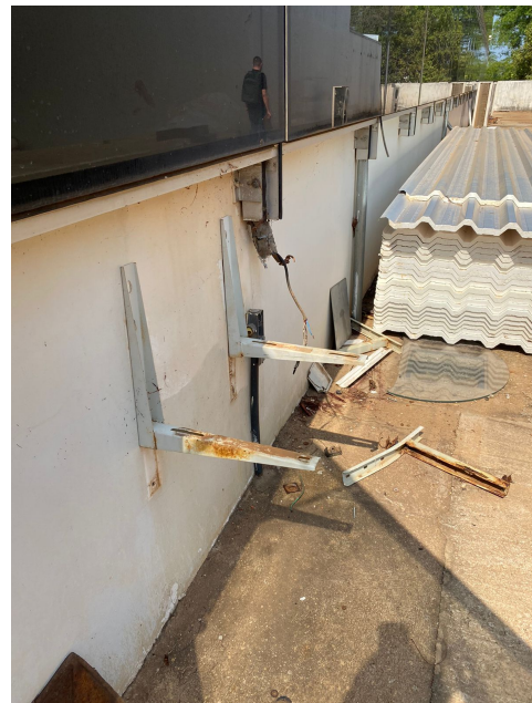
Parte externa do condicionador de ar levado no furto do dia 09/10/2022