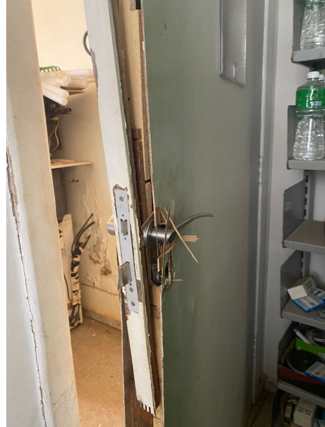
Porta da garagem que dá acesso ao CRM-TO devido ao furto do dia 09/10/2022