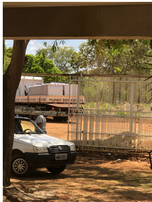
Telhas entregues no dia 31/10/2022 às 10h:34min