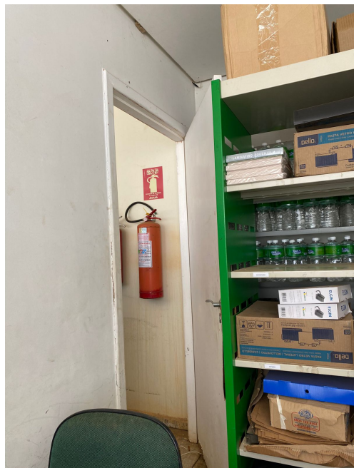
Porta arrombada no furto do dia 30/10/2022