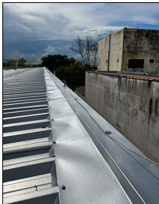
Imagem 01 e 02: serviço realizado de cumeeira metálica e rufo