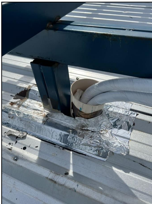
Imagem 03: serviço de fechamento dos shafts com manta aluminizada