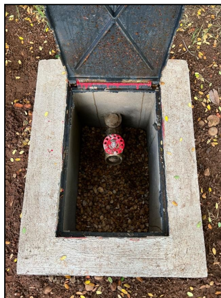
Imagem 04 e 05: serviço de execução de hidrante de alarme e hidrante de recalque