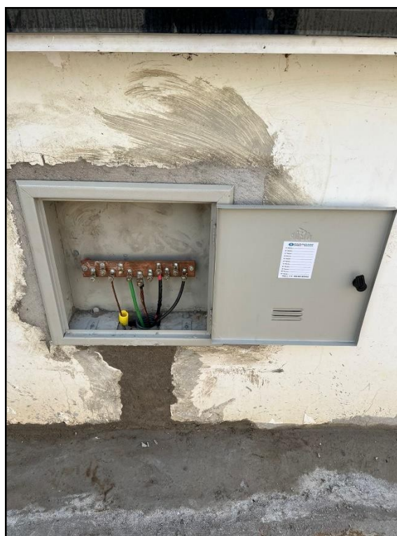
Imagem 06 e 07: instalação para-raio tipo Franklin e quadro de aterramento